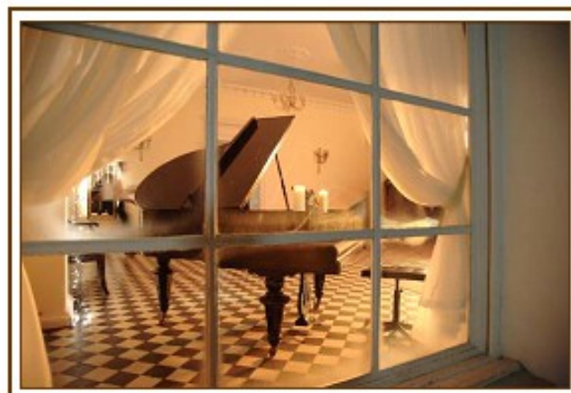
Sala Konferencyjna 50 m2